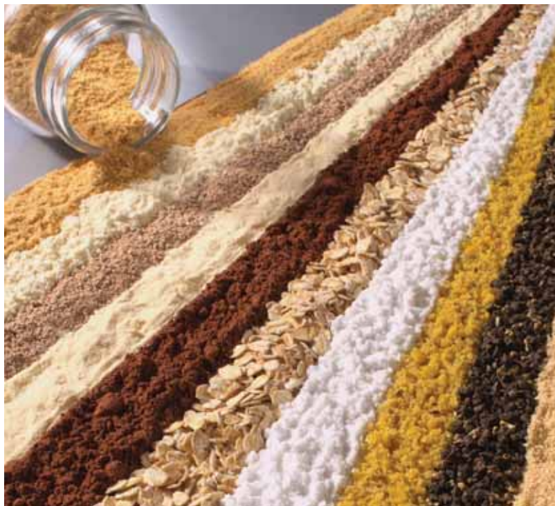
Produkte, die mit dem ORBIS abgefüllt werden können