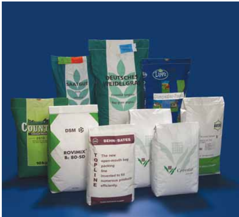
Säcke, die mit dem ORBIS verarbeitet werden können