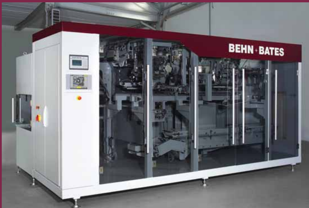
BEHN + BATES-TOPLINE - Der Vollautomat für die Abfüllung pulverförmiger Produkte in offene Säcke mit Füllgewichten von 10 bis 25 kg bei Leistungen von 200 bis 600 Sack pro Stunde

BEHN + BATES – Ihr zuverlässiger Partner, wenn es darum geht, Nahrungsmittel effizient und sauber zu verpacken.